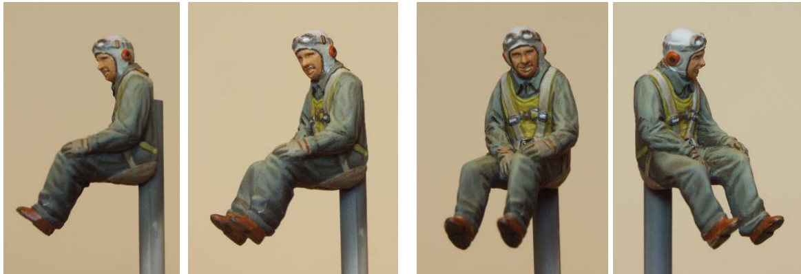
[13] Completed Mustang pilot (who now finds himself in the Navy!) Le pilote de Mustang terminé (qui se trouve maintenant enrôlé dans la marine!)

l'étui du pistolet et les divers sacs sont peints d'une couleur vert terne. Le fourreau pour le couteau "K-bar" a été fini en gris et le manche du couteau en marron à l'huile.