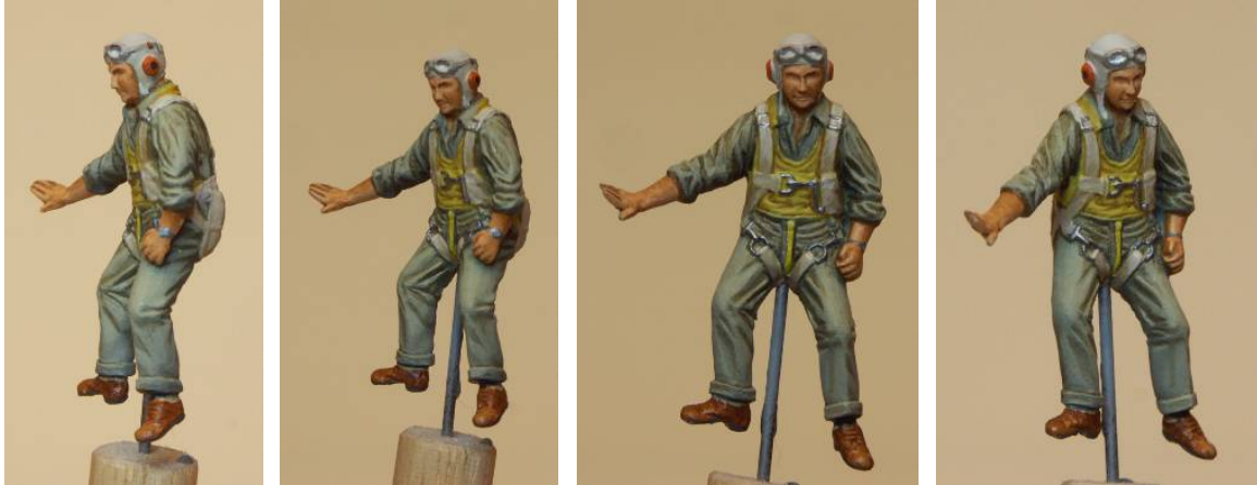
[15] The other pilot figure included in the Tamiya Corsair kit. L'autre pilote Tamiva. venant de la boîte du Corsair.

Le porte-carte a été peint en gris foncé et une carte peinte en se basant sur la photo de référence de droite. Il semble y avoir un dispositif d'aide à la navigation inclus dans le haut du porte-carte et j'ai essayé d'en faire une représentation (peu !) convaincante. Il y a aussi un bloc-note dans un coin.