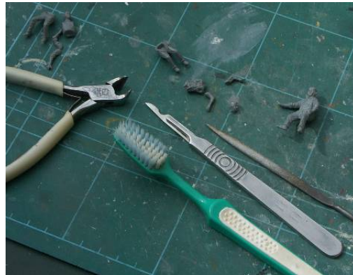
[4] Parts removed from sprue using cutters (flush cutting type are best) and mould lines removed by knife or file. I use an old toothbrush to clear away the debris. Les pièces sont séparées de la grappe en utilisant une pince coupante (de préférence sans chanfrein) et les lignes de joint supprimées au moyen d'un cutter ou d'une lime. J'utilise ensuite une vieille brosse à dents pour nettoyer.

The parts are then attached to a holder for painting [5].