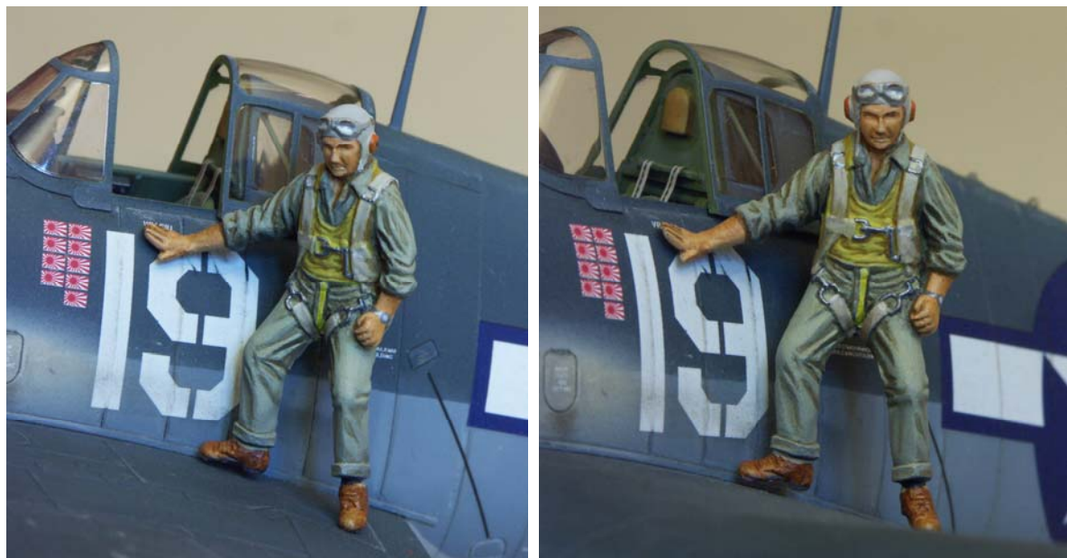
[18] Completed figure depicted on Eduard's Hellcat kit.

Alors, les figurines mettent-elles en valeur votre modèle ? J'en ai placée une sur le Hellcat que j'ai fait l'année dernière (il faudrait que je le finisse un jour !). Je pense qu'il rend assez bien ! [18]