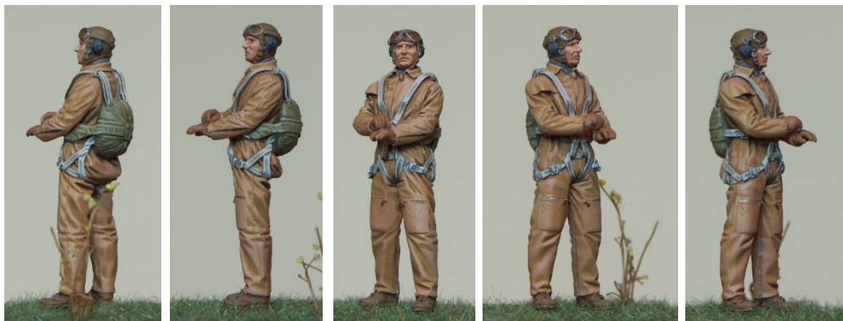
Resin figurine at the 1/48 scale coming from a set Jaguar. Painted with oils by using the technique described in this article. Figurine en résine à l'échelle 1/48 provenant d'un set Jaguar. Peinte aux huiles en utilisant la technique décrite dans cet article.