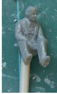
[2] Standard Tamiya figure from the Mustang kit that was kicking around in my spares box. Figurine de la maquette Tamiya du Mustang qui se trouvait dans ma « boîte à rabiote ».