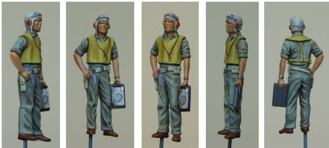
[10] Completed Monogram Pilot. Le pilote Monogram terminé.

The other work done at this stage was to undercoat the life vest in pale yellow. I will describe the detail painting of Monogram pilot figure [10] as all other pilots were finished in the same way. Then I will describe what was done for the remaining two figures.