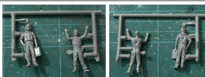
[1] Two figures from the Monogram Devastator kit (front and back views). Having soft detail and serious sink marks, these would be a challenge. They are also, to me at least, "classic" Monogram and evoke nostalgia. Deux figurines du kit Monogram du Devastator (vues recto-verso). Avec leurs détails hésitants et leurs retassures, elles représentent un challenge. Elles ont aussi, pour moi du moins, un certain parfum de nostalgie.

Cependant, me demandant s'il était malgré tout possible d'obtenir des résultats satisfaisants en utilisant des figurines fournies dans les boîtes de maquettes, j'ai décidé de faire un essai. J'ai choisi plusieurs niveaux de qualité, allant des figurines fournies avec l'ancien Devastator de Monogram [1] à celles, plus récentes, fournies avec le Mustang [2] et le F4U Corsair [3] de Tamiya. Toutes sont à l'échelle 1/48.