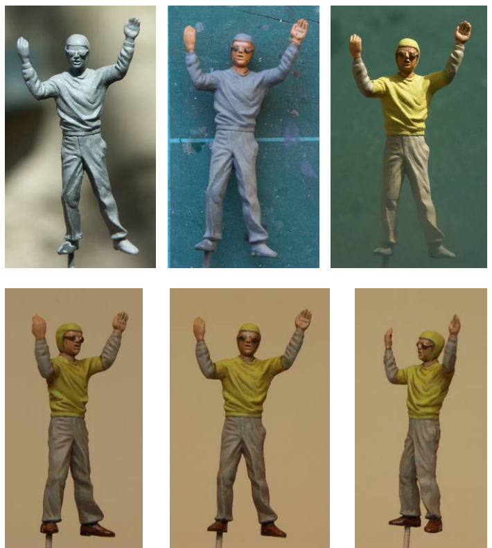
[16] Painting the Monogram flight deck controller. Peinture du contrôleur de pont Monogram.

The yellow top and cap of the flight deck controller [16] was treated in the same way as the life vests of the pilot figures. The trousers were painted with