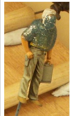
[12] Masking with Silly Putty to airbrush the flying helmet.

La ceinture toujours enduite de "Rotting Flesh", est ombrée près de