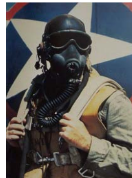
[7] Airman wearing HBT flight suit. Membre d'équipage vêtu d'une combinaison HBT.

Les figurines sont nettoyées au détergent puis séchées avant de passer une couche d'apprêt Alclad à l'aérographe. Normalement, je poursuis avec une sous-couche gris clair, mais sur des petites figurines je saute cette étape. J'ai décidé d'habiller mes quatre membres d'équipages avec des combinaisons de vol Herringbone Twill (HBT), dans l'idée de m'exercer avant de m'attaquer à une figurine 54mm d'un US Marine que j'ai en projet, portant la même tenue. La photo [7] montre une combinaison de ce type et quelques autres détails. La photo [8] détaille les premières étapes de la peinture. Appliquant ma technique