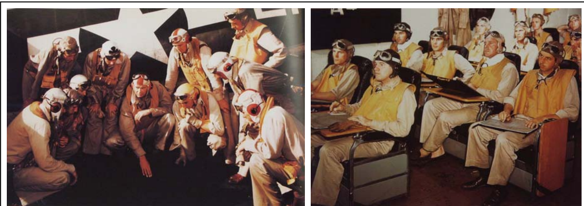
[11] Other reference photos used for the aircrew. Autres photos de référence utilisées pour l'équipage.

J'ai choisi de faire le casque de vol en blanc, en utilisant la photo [11] comme référence.