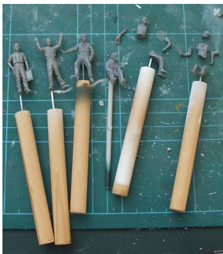
[5] Parts attached to handles for painting. This is made from sawn off lengths of dowelling with a panel pin pressed into the end. Cut the top from the nail, fashion the end into a point and press this into the hole drilled into the figure. Les pièces sont fixées sur des manches pour la peinture. Ceux-ci sont réalisés à l'aide de baguettes de bois, à l'extrémité desquelles une aiguille est enfichée. La tête de l'aiguille est alors coupée, affûtée et enfichée dans un trou foré dans la figurine.

The parts are then attached to a holder for painting [5].